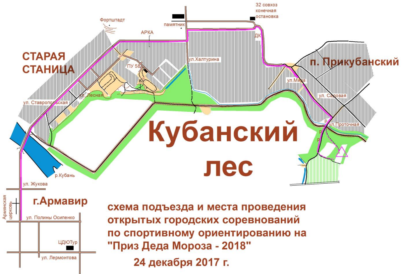
СХЕМА подъезда к месту проведения соревнований: